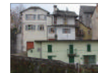
TAVOLA 14 PROGETTO

AMBITO 03 - Strada Comunale Varzo La Colla Coggia e Piazza della Torre